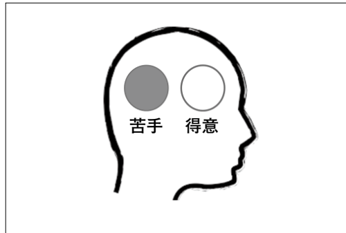
図2 個人内の「苦手－得意」

*障害のある子について「苦手－得意」で表現するのは、だれにもある個人内の「苦手－得意」のアナロジーとして理解されることを意図した説明であることがある。